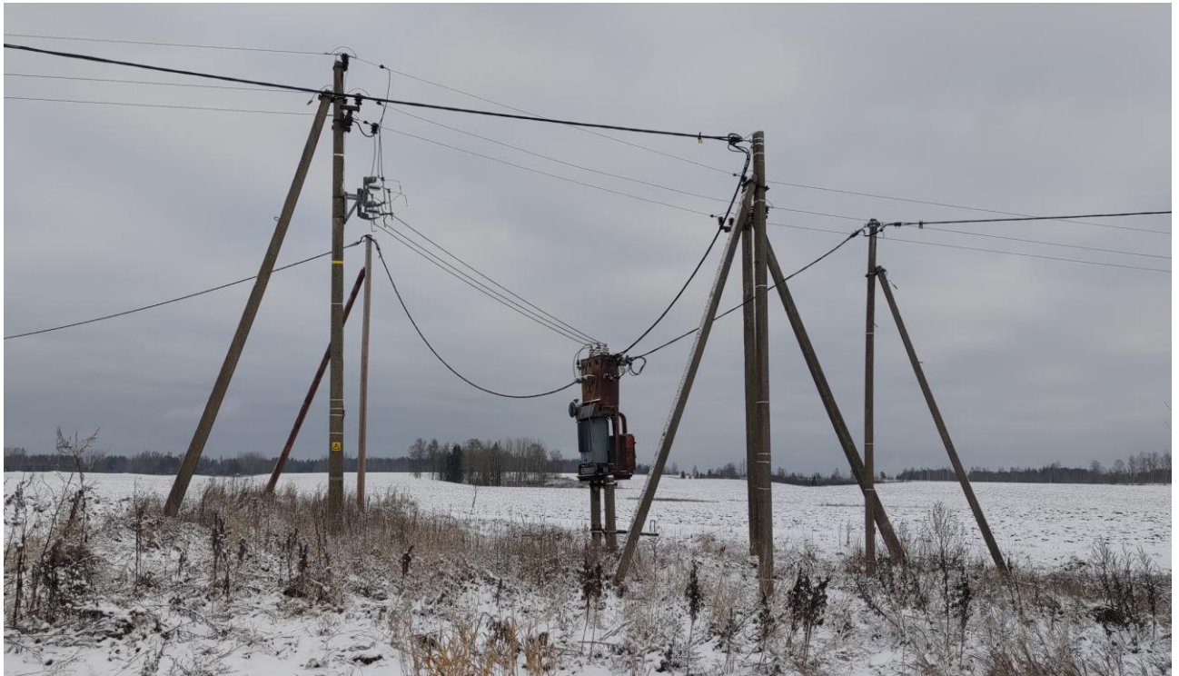
Joonis 3.1 – Olemasolev AJ Tikuti.

Paigaldada mastile 0,4 kV JS, kuhu paigaldada fiidrikaitselülitid ja bilansiarvesti.